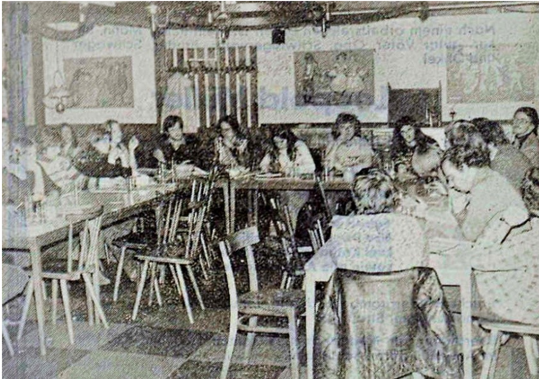
Abb. 2: „Nachdenkliche Gesichter bei „Grünen“ und Umweltschützern: Ein Landtagkandidat wurde auch heuer nicht gefunden“, Foto: Albert Neff, BNN, 17. Januar 1980.

Es war üblich, dass die neu gegründeten Kreis- oder Ortsverbände, anfangs auch Ortsvereine genannt, für alle Orte im Wahlkreis zuständig waren, da die Mitgliederzahl für Ortsverbände oft nicht ausreichte. So ist das Gründungsdatum für den Ortsverein Bruchsal, der für den Wahlkreis Bruchsal zuständig war, der 15. Januar 1980. Ein separater Kreisverband entstand erst mit der Gründung von Ortsverbänden 1983. 31