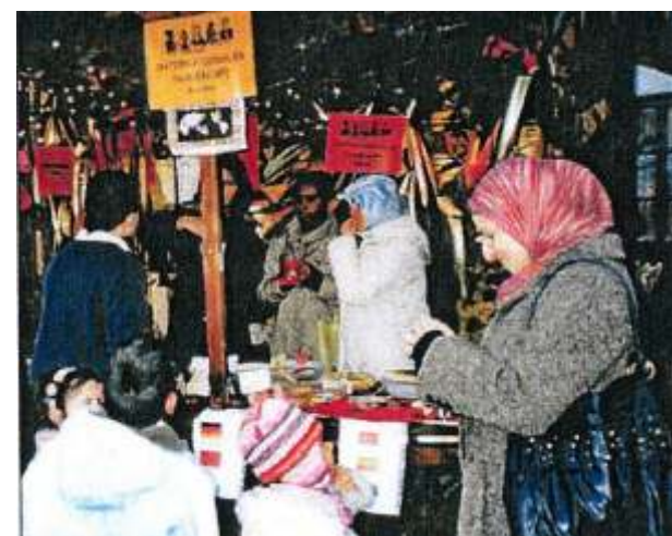
Stand auf dem Weihnachtsmarkt, 21.12.06