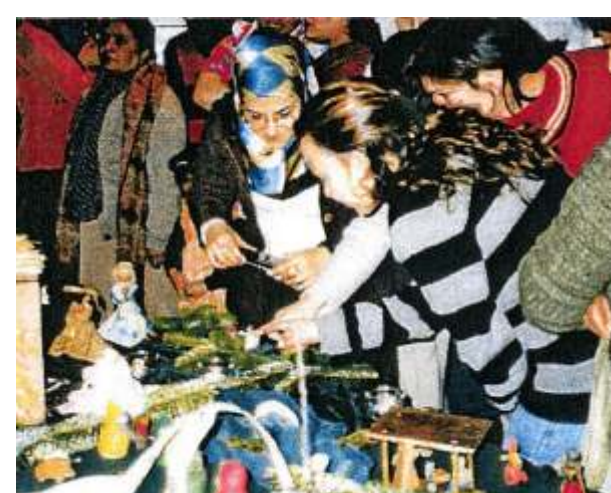
Tradition der Weihnachtststrümpfen, mit dem Evangelischen Frauenkreis, 14.12.06

Aus dem weiterhin aktiven Frauencafé geht das erste Internationale Stadtfest hervor.