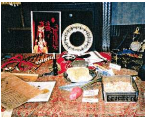
Vortrag Der orientalische Basar, 14.11.06