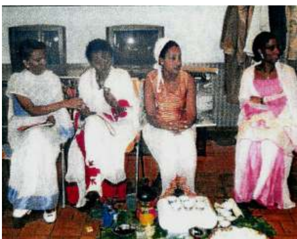
Vortrag Neujahr in Äthiopien, 26.10.06