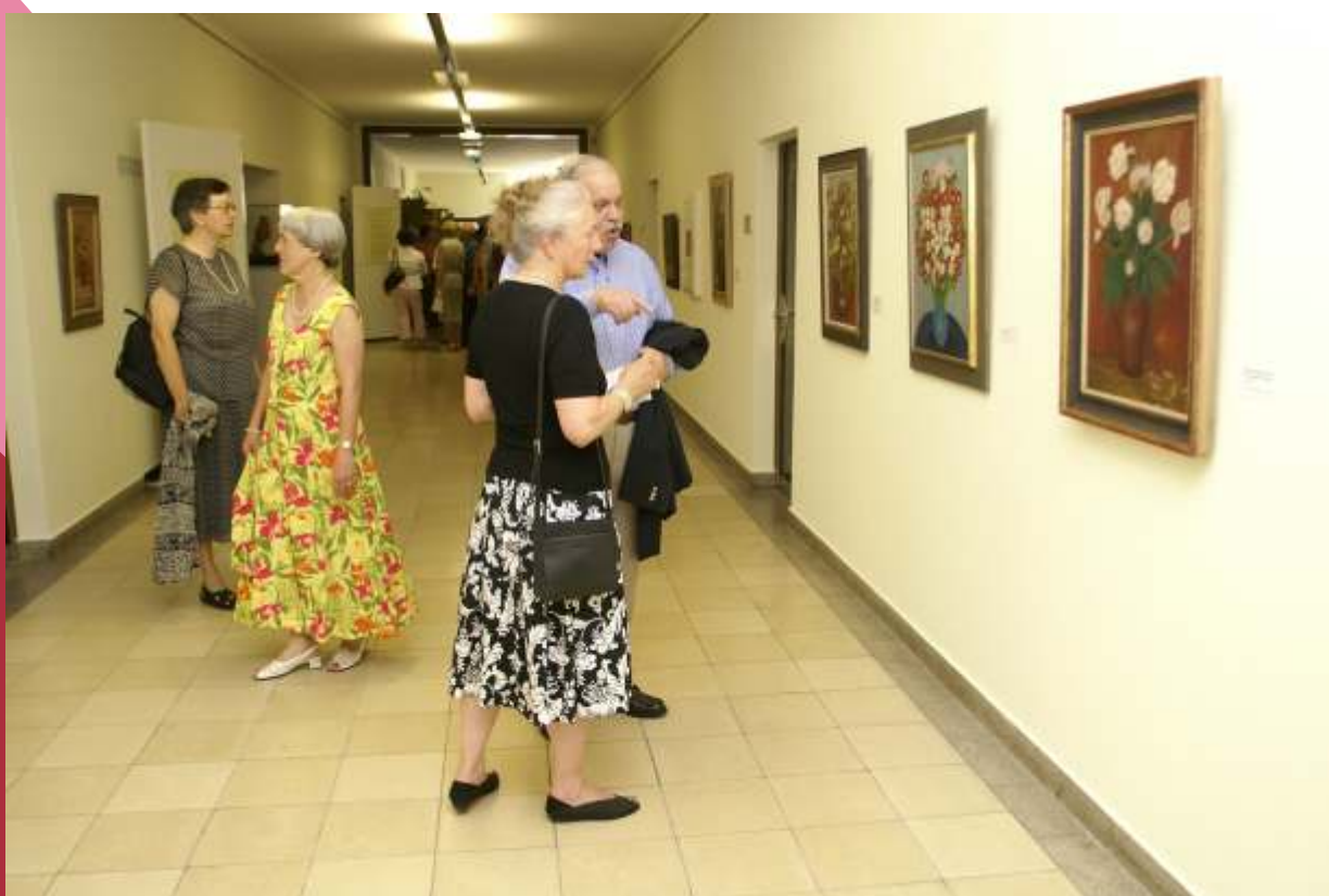
Eröffnung der Eißler-Ausstellung im Rathaus, 21.7.06