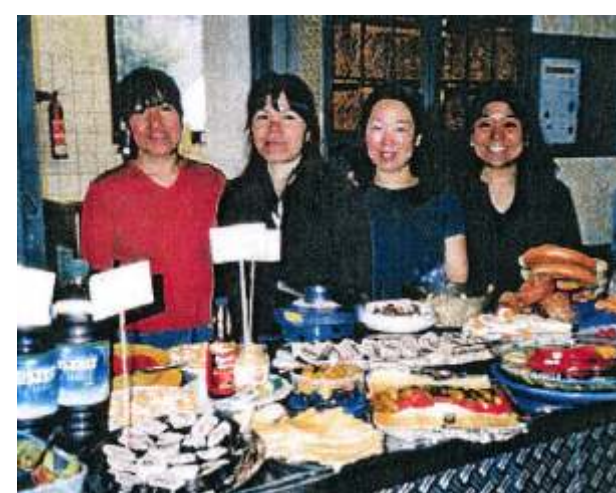
Vortrag Heimat Südostasien, 18.5.06