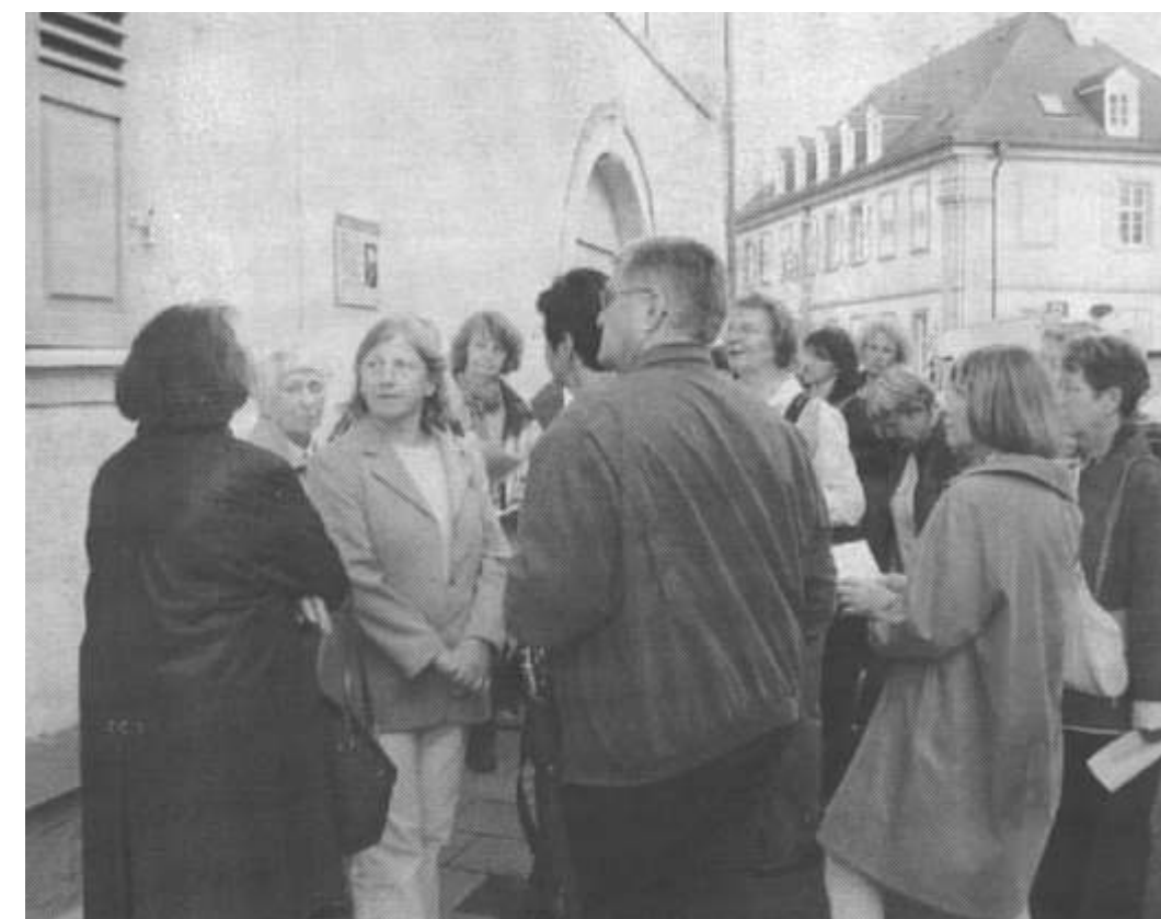
Frauenstadtrundgang am 27.10.06

Bruchsaler Spaziergang widmet sich dem Leben von Frauen aus drei Jahrhunderten