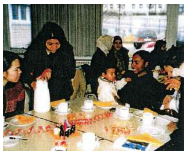
Karneval und Fasching, 23.2.06