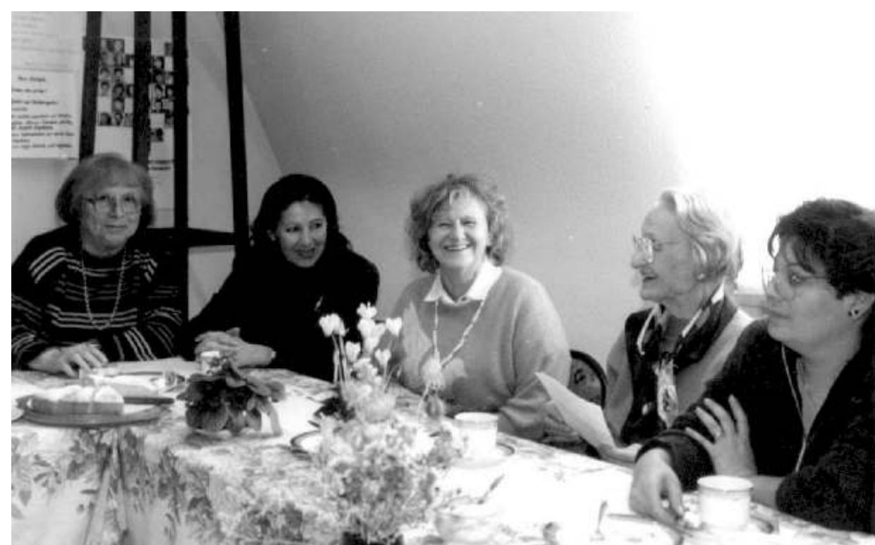
Türkische und deutsche Frauen beim Erzählcafé im Büro für Frauenfragen, 27.10.93

Im Oktober treffen sich im Erzählcafé im Büro für Frauenfragen deutsche und türkische Frauen, um sich besser kennen zu lernen. Am Frauensonntag Ende November unterhalten sich Frauen bei Kaffee und Kuchen über das Thema Das Kopftuch- Zierde oder Zwang . Am Rathaus weisen lila-farbene Luftballons den Weg. Die Veranstaltung findet zusammen mit dem noch recht jungen Bruchsaler Frauennetzwerk statt, das eine Plakatsammlung über Frauenarbeit ausstellt.