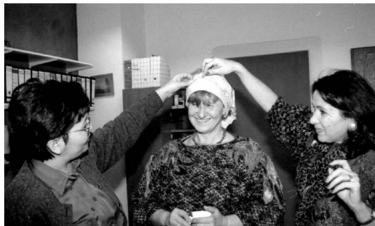
Fotos unten links, rechts und oben: Frauensonntag in der dunklen Jahreszeit, 21.11.93