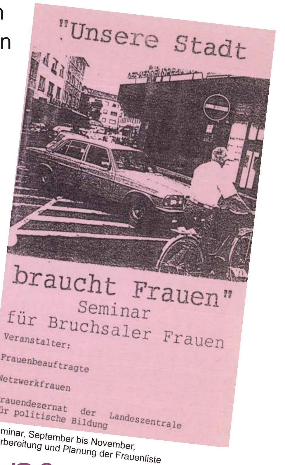
Seminar, September bis November, Vorbereitung und Planung der Frauenliste

Wegen Megerles politischer Aktivitäten und der Treffen der neuen politischen Gruppierungen im Büro für Frauenfragen kommt es zu Unstimmigkeiten mit der Verwaltungsspitze.